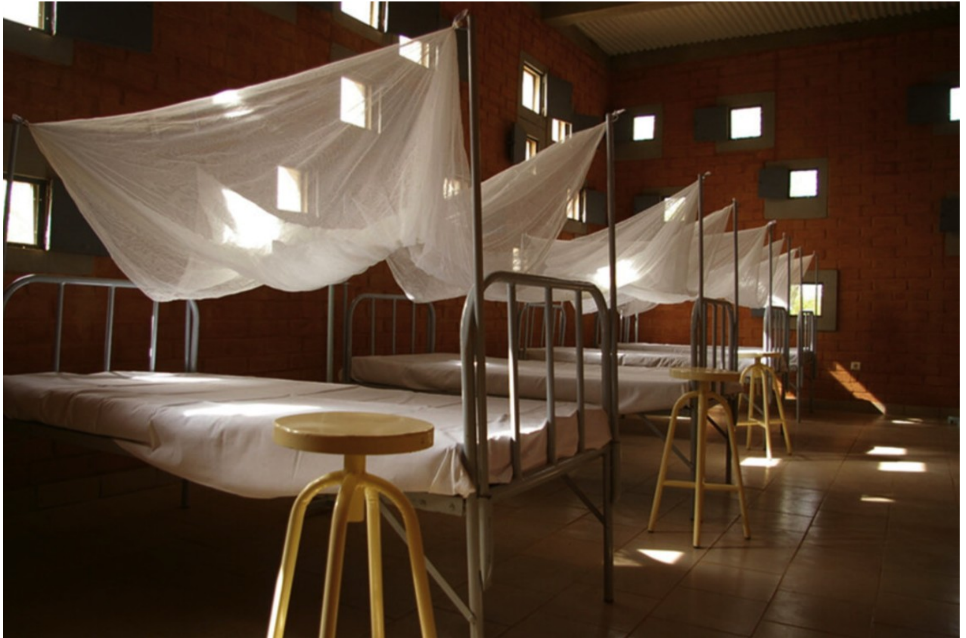
14 Foto ©Thierry_K_Oueda (gehört zu Foto 13)