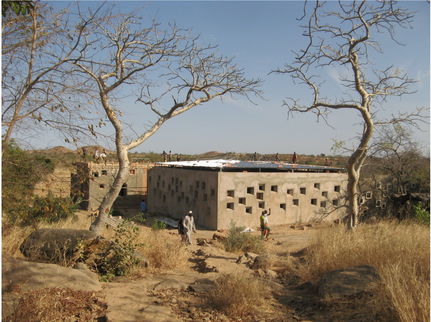
13 (gehört zu Foto 14)